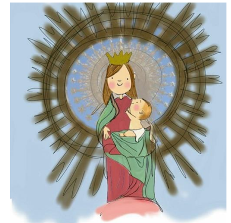
Virgencica del Pilar

✠ La colecta del próximo domingo, 18 de octubre, se destinará al DOMUND . Es lo que se llama una “colecta imperada”, es decir, que está destinada íntegramente a las necesidades de otras comunidades o instituciones cristianas.